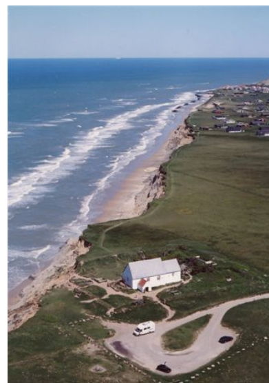
juni 2005